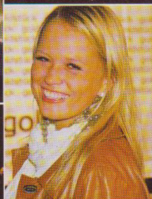
Wahlhamburgerin Nova Meierhenrich